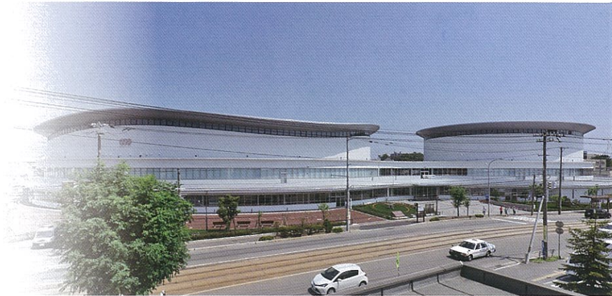
函館アリーナ 〒042-0932 函館市湯川町1-32-2 ☎0138-57-3141

記者会見 連合会理事・士会長合同会議 建築士(青年)フォーラム等 全国ヘリテージマネージャー ネットワーク協議会総会